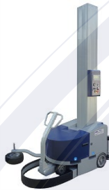
Maquina con columna h=2800 (opcional)