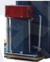
Carro con pre-estiro motorizado (opcional)