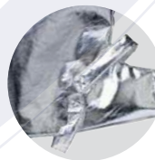
Dos cintas de sujeción.